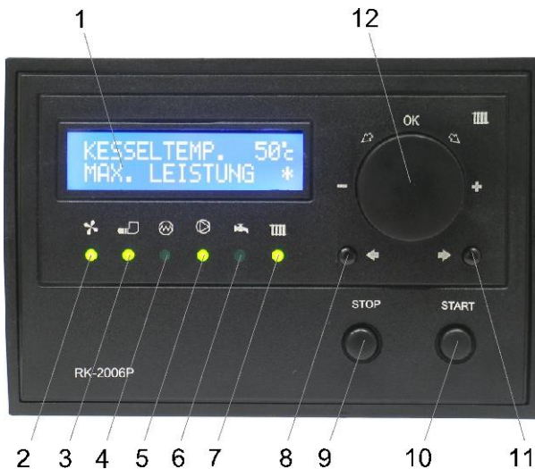
Abbildung 1. Frontplatte vom Regler RK-2006LP.